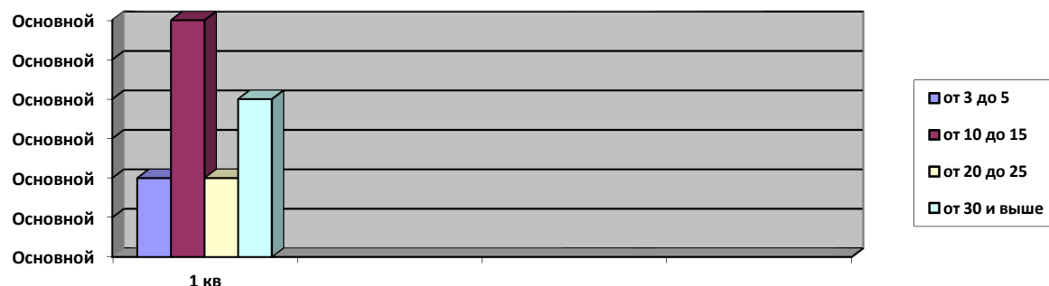
«по стажу работы»